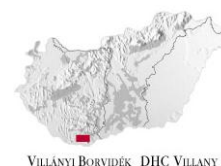
VILLÁNYI BORVIDÉK DHC VILLÁNY