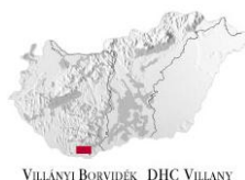
VILLÁNYI BORVIDÉK DHC VILLÁNY